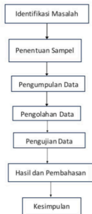
Gambar 2. Alur Penelitian