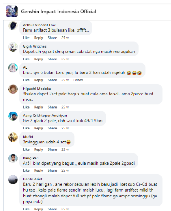
Gambar 5. Contoh persaingan di dalam komunitas Genshin Impact Indonesia Official

Terdapat juga persaingan yang dilakukan oleh antar anggota. Walaupun Genshin Impact tidak termasuk sebagai game kompetitif tanpa adanya fitur player vs player di dalam game, terdapat persaingan yang muncul di dalam komunitas. Hal ini dikarenakan rasa kompetitif yang muncul antar anggota ketika melihat keberuntungan anggota lain di dalam games tersebut. Keberuntungan di dalam games tersebut menimbulkan keinginan untuk bersaing dengan anggota lainnya.