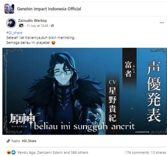
Gambar 2. Contoh postingan mengenai berbagi informasi di dalam komunitas