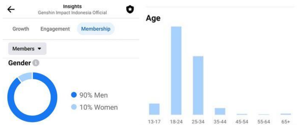
Gambar 4. Partisipan di dalam Komunitas Genshin Impact Indonesia Official

Dengan jumlah anggota sebesar lebih dari 175 ribu, mayoritas anggota Genshin Impact Indonesia Official yang ada merupakan laki-laki dengan presentase hingga 90%. Anggota perempuan di dalamnya hanya sebesar 10% saja. Selain itu rata-rata anggota aktif di dalam komunitas ini memiliki rentang usia 18-34 tahun.